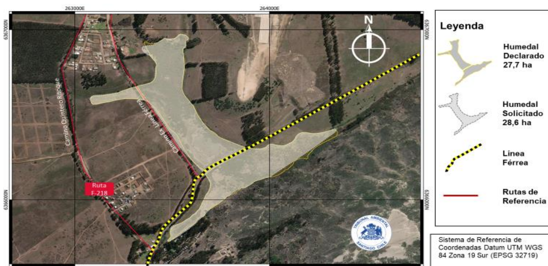
Fig. N° 1. Cartografía Comparativa polígonos Humedal Urbano Los Juanes